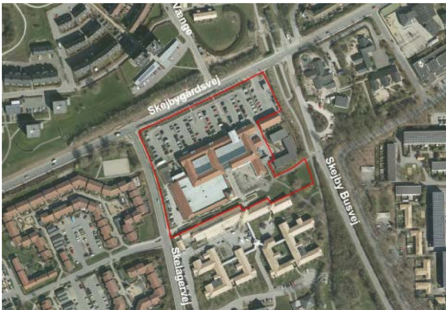
Den nye planlægning skal omfatte området markeret med rødt