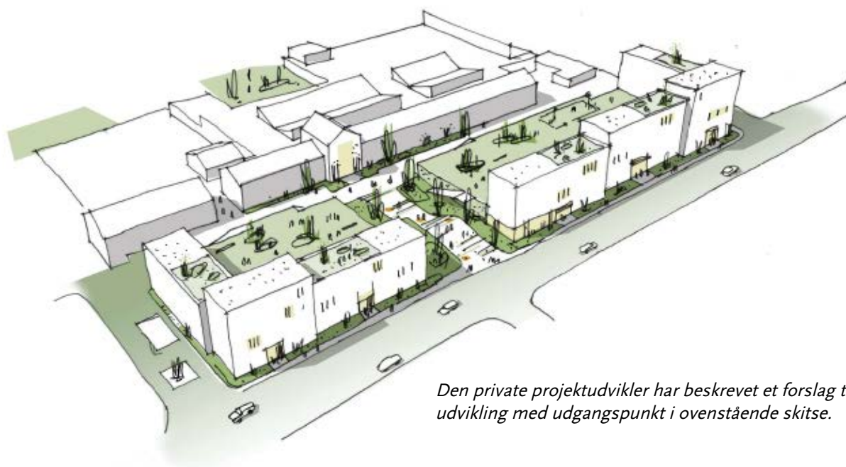
Den private projektudvikler har beskrevet et forslag til områdets udvikling med udgangspunkt i ovenstående skitse.